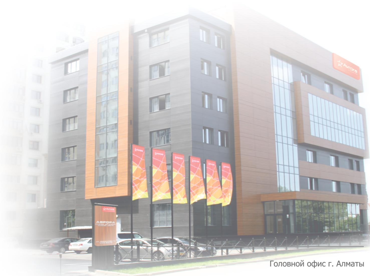
Головной офис г. Алматы

Каждый раз покупая отечественную продукцию, Вы помогаете нашей стране!