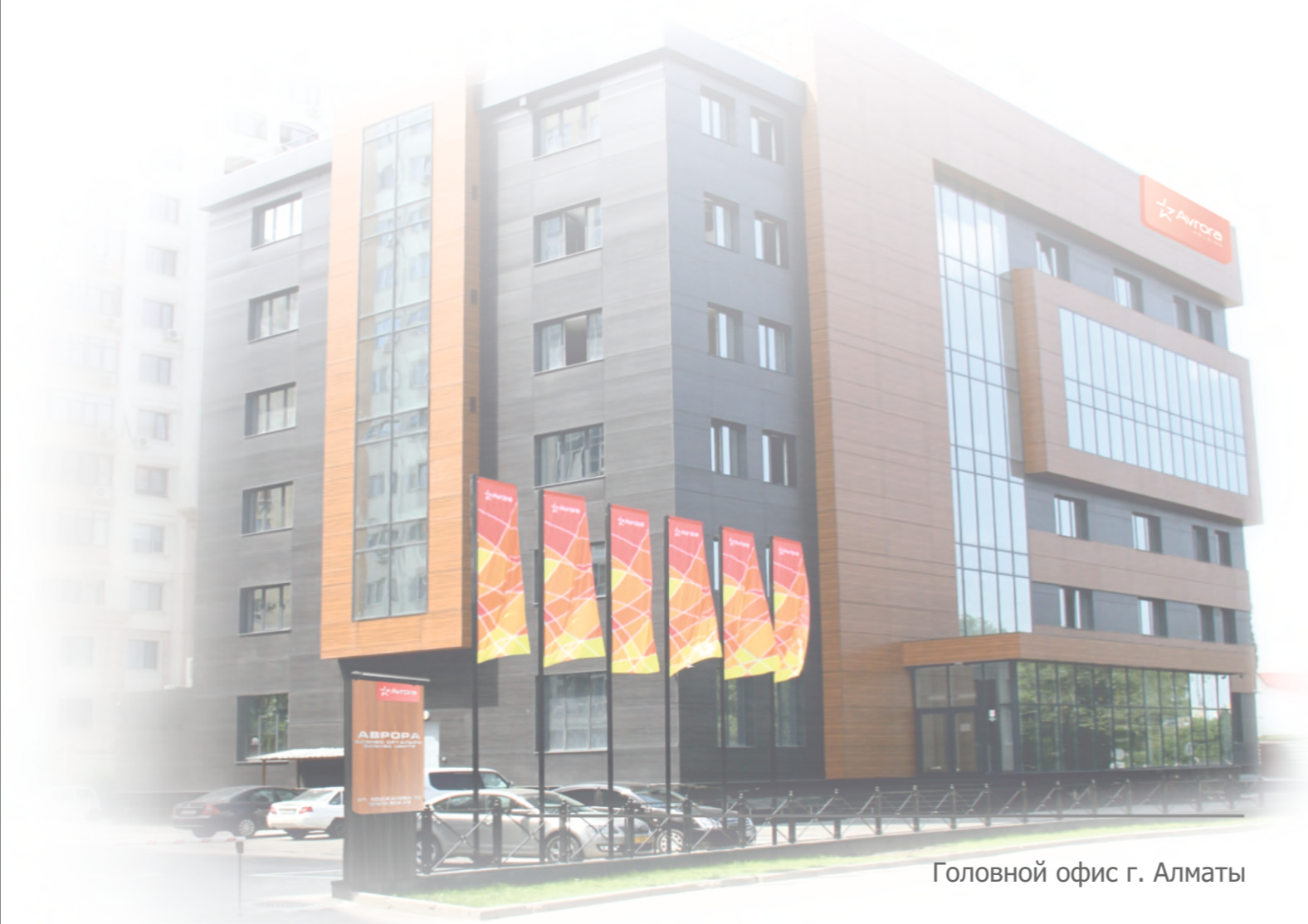
Головной офис г. Алматы

Каждый раз покупая отечественную продукцию, Вы помогаете нашей стране!